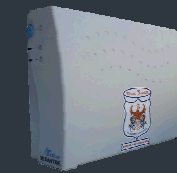
Twin Guards 500VA

Công suất 500VA/300W, Dòng sản phẩm Offline, thời gian sạc điện 10 h