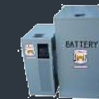
Santak Online C6KS

Công suất 500VA/300W, Dòng sản phẩm Offline, thời gian sạc điện 10 h